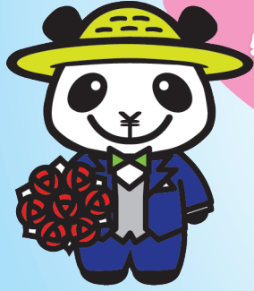
JAバンクえひめキャラクター ばんじゃくん